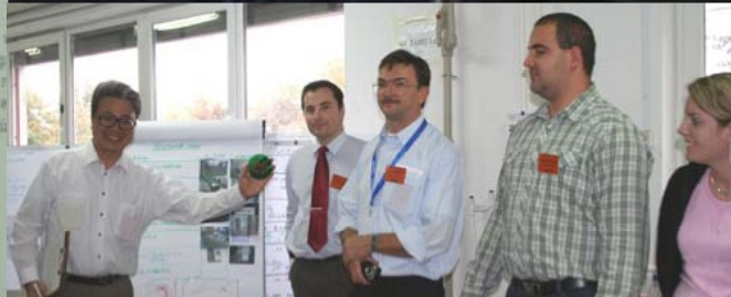
A japán „Öveges professzor” és egy sikeres, pazarlásmentes megoldás értékelése egy 3 napos workshop végén