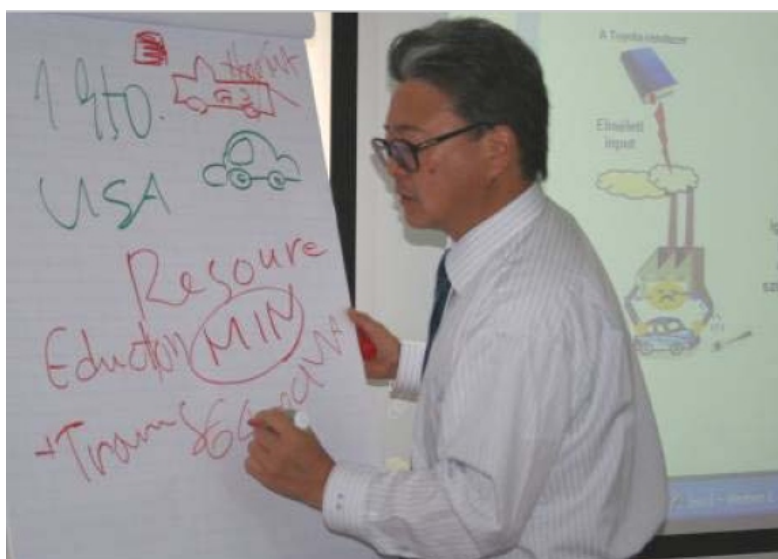
A Toyotánál a folyamatos képzés a mindennapok része